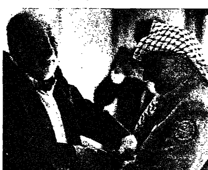
مصافحة حارة بين عرفان وكرايسكي

قال مستشار النمسا السابق برونو كرايسكي انه يشعر بتفؤل مشوب بالخطر بشأن احتمالات السلام في الشرق الأوسط، بعد اجتماع غير رسمي السيد ياسر عرفات رئيس منظمة التحرير الفلسطينية، وقال السيد كرايسكي في السابق كانت جميع الدول الديمقراطية الأوروبية ضد إضافة قوله أنه شعر بسعادة لأن الملك خوان كارلوس ورئيس الوزراء فيليب غونزاليس التقيا بالسيد عرفات في أسبانيا. وقد اجتمع السيد عرفات أمس الأول مع وزير خارجيه اسبانيا وفرنسا واليونان الذين يتولون مبادرة سلام اوروبية بشأن الشرق الأوسط. ويعد الاجتماع الذي عقد على ملادة الغداه سائر السيد عرفات إلى تونس في طائرة تابعة للقوات الجوية العراقية.